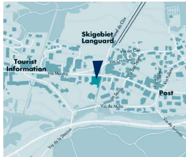
Pontresina: Bellavita Piscina e Spa Via Maistra 178, CH-7504 Pontresina